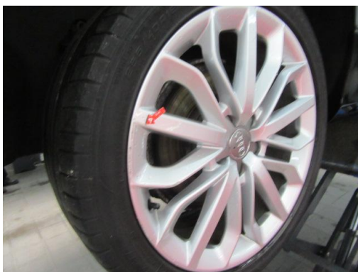
2. Rad hinten rechts Felge beschädigt

Hierbei handelt es sich um kein technisches Funktionsprotokoll bzw. -gutachten.